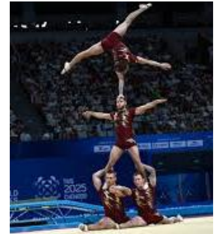
Men's Group Herrengruppe