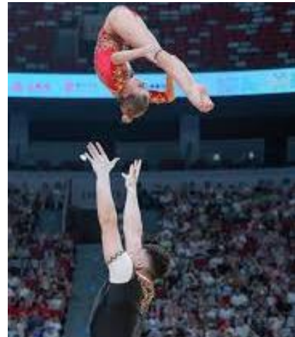
Mixed Pair Gemischtes Paar