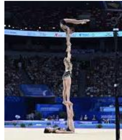
Women's Group Damengruppe