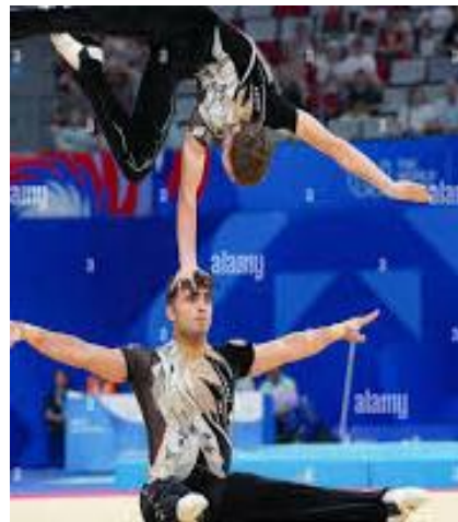
Men's Pair Herrenpaar