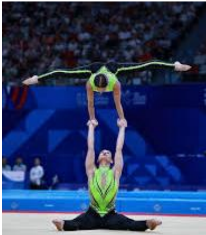
Women's Pair Damenpaar